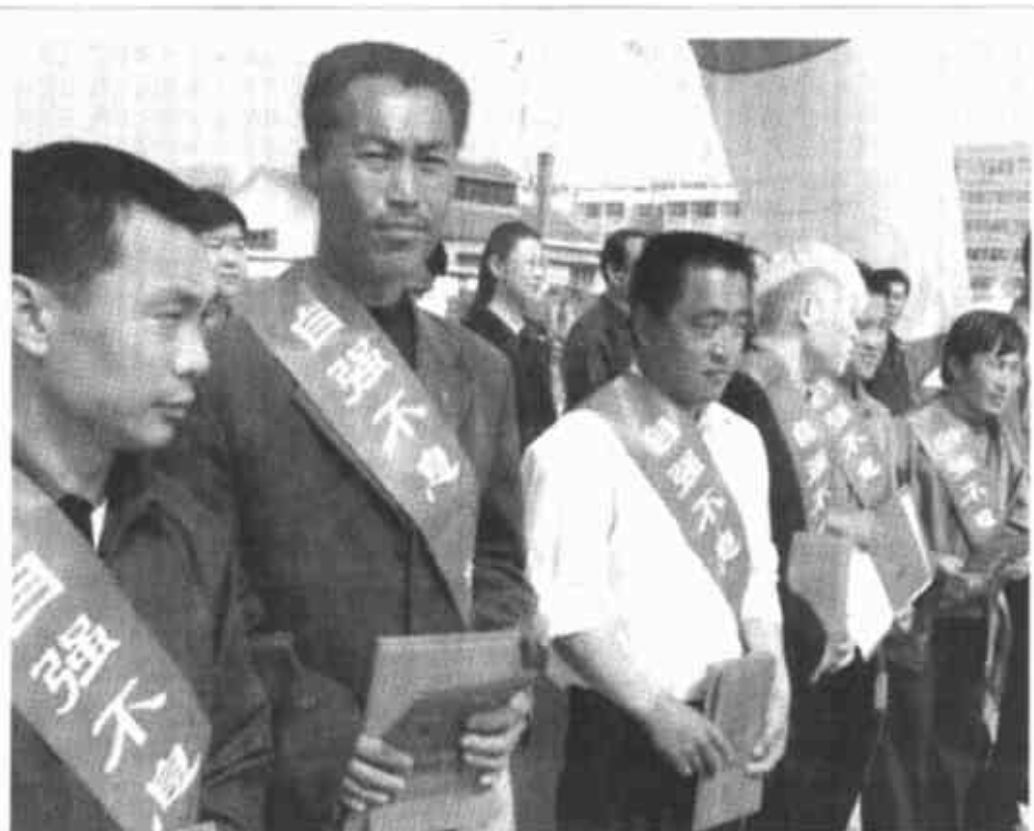
近日，垦利县开展了系列助残活动，向参加省第六届残运会获得名次的运动员颁发了奖金，表彰奖励10名残疾人自强模范，向10名特困肢体残疾人捐赠了轮椅，向10名特困重度残疾人发放定额补助金，走访慰问了100多户残疾人家庭。图为受表彰的10名残疾人自强模范。