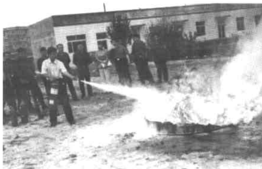
6月10日下午，东营区消防大队增强了消防意识，重视了防火安全的责任感，也更加融洽了警民关系。消防培训。通过此次培训，学员们更加